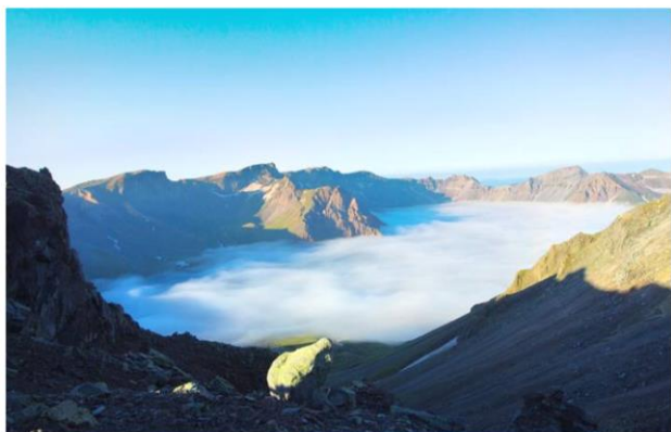
长白山南坡风景区