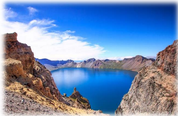
长白山北坡风景区